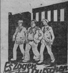
Es folgen drei Burschen

Ab heute Samstag mit Dienstag! Der lebensvollste und schönste aller deutschen Groß-Filme: